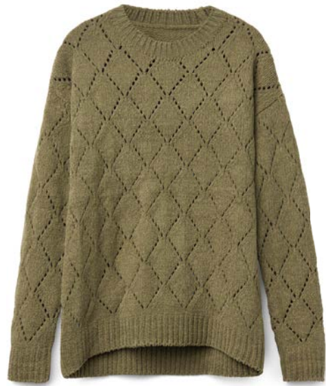
Sweter z włóczki typu chenille, o grubym splocie, z ażurowym wzorem w romby, ze ściągaczami u dołu i na rękawach, rozmiary: S-XXL